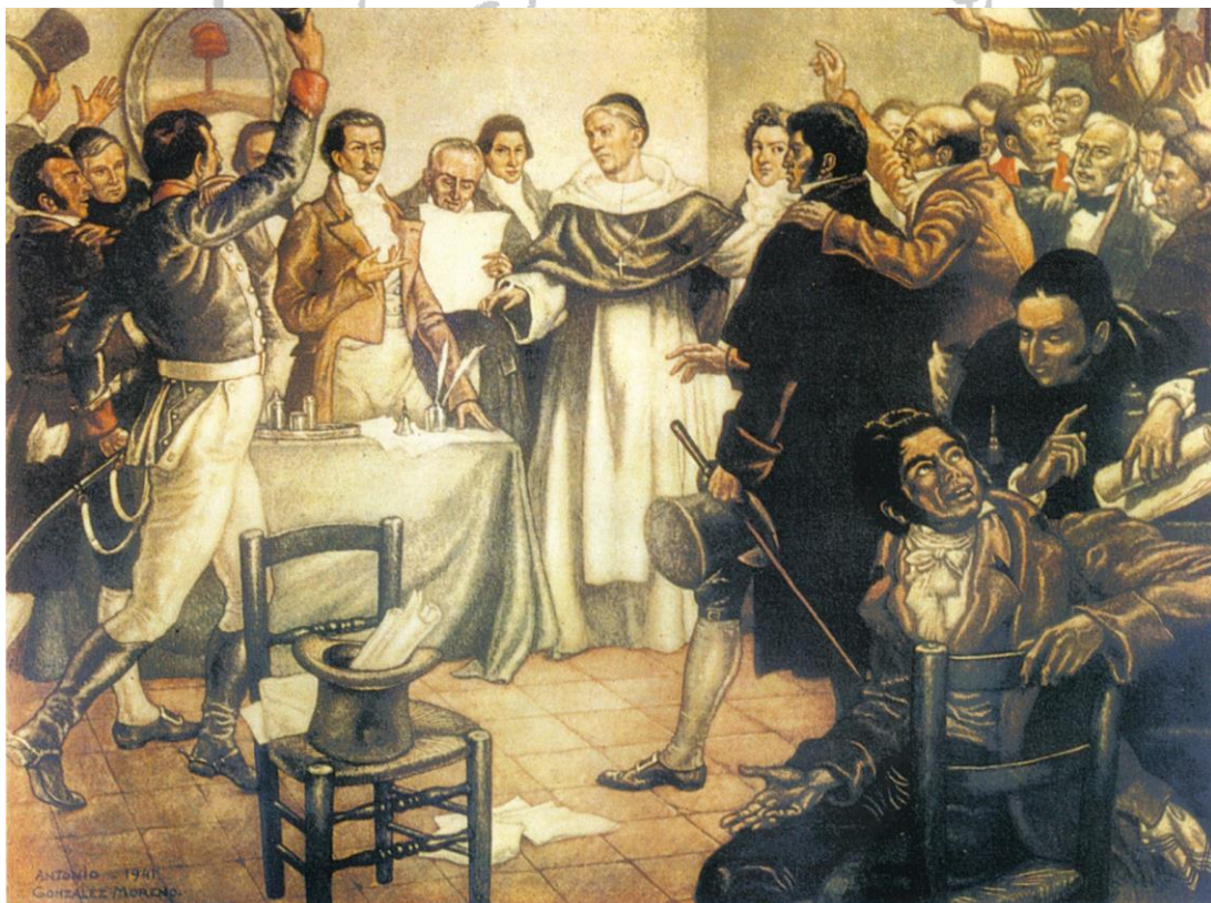
9 de Julio de 1816. Declaración de la Independencia. Acuarela de Antonio González Moreno. Colección Museo Histórico Nacional.