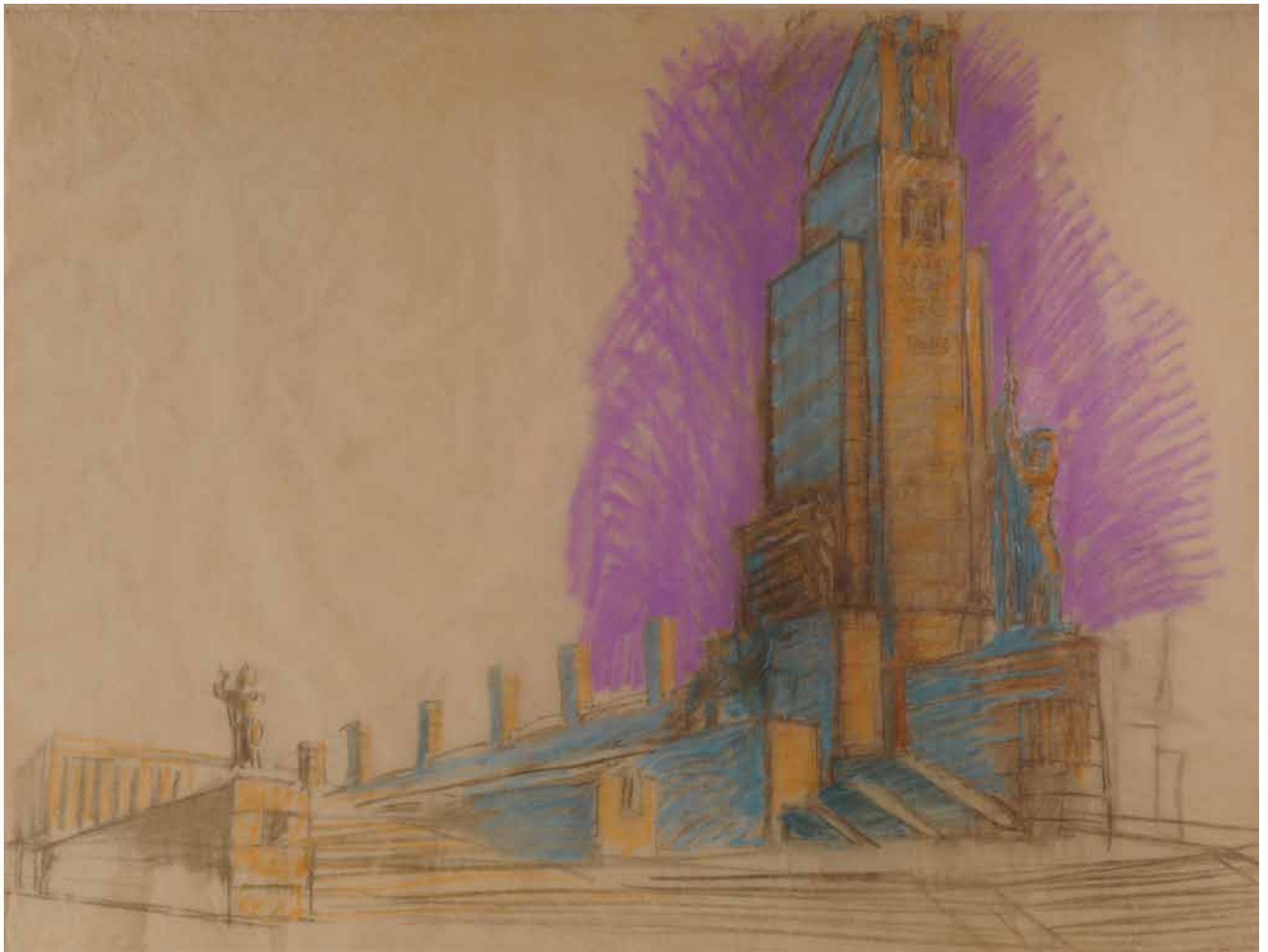
102 cm alto x 137,50 cm ancho. Lápiz sobre papel vegetal.