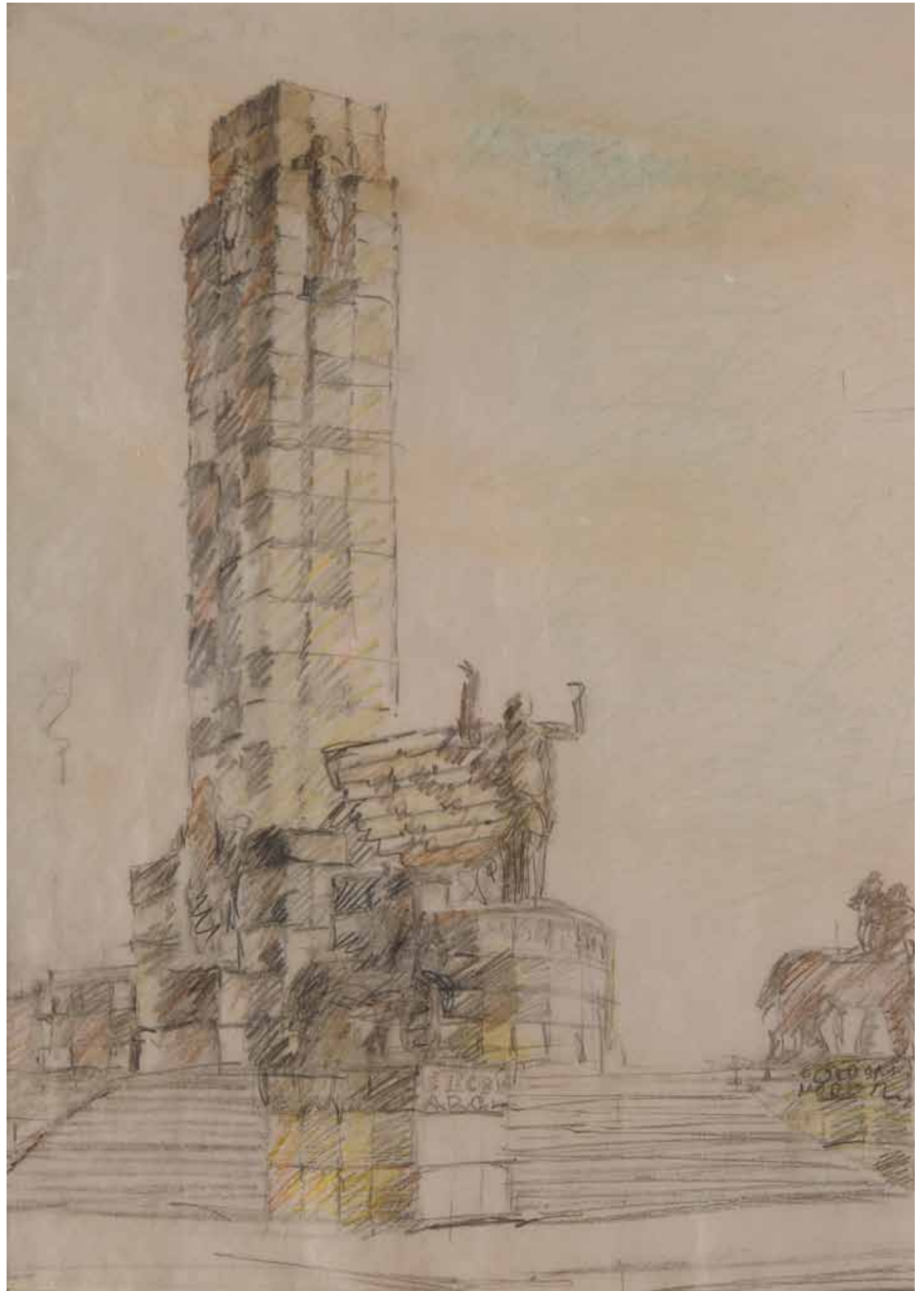
102 cm alto x 78 cm ancho. Lápiz sobre papel vegetal.