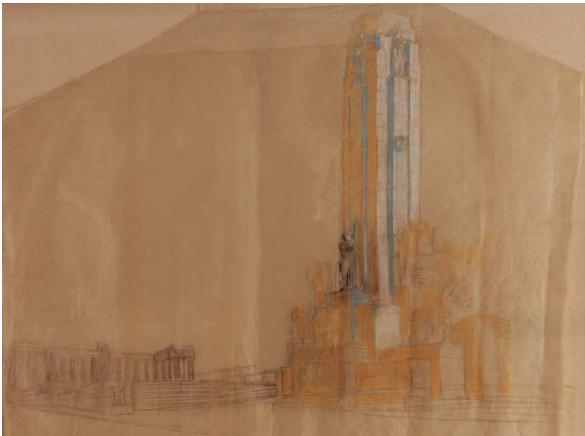
102 cm alto x 137,50 cm ancho. Lápiz sobre papel vegetal.