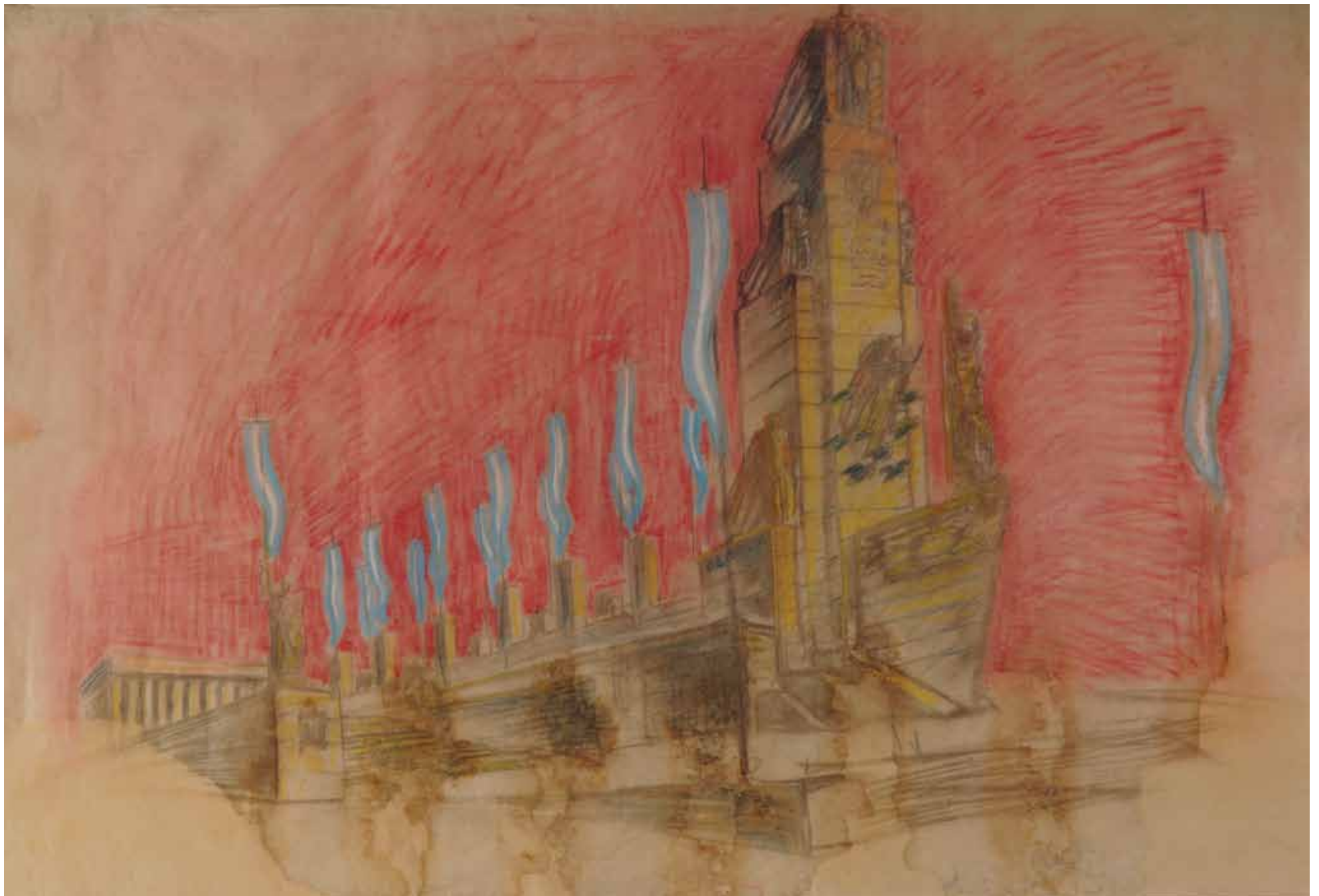
110 cm alto x 162,50 cm ancho. Lápiz sobre papel vegetal.