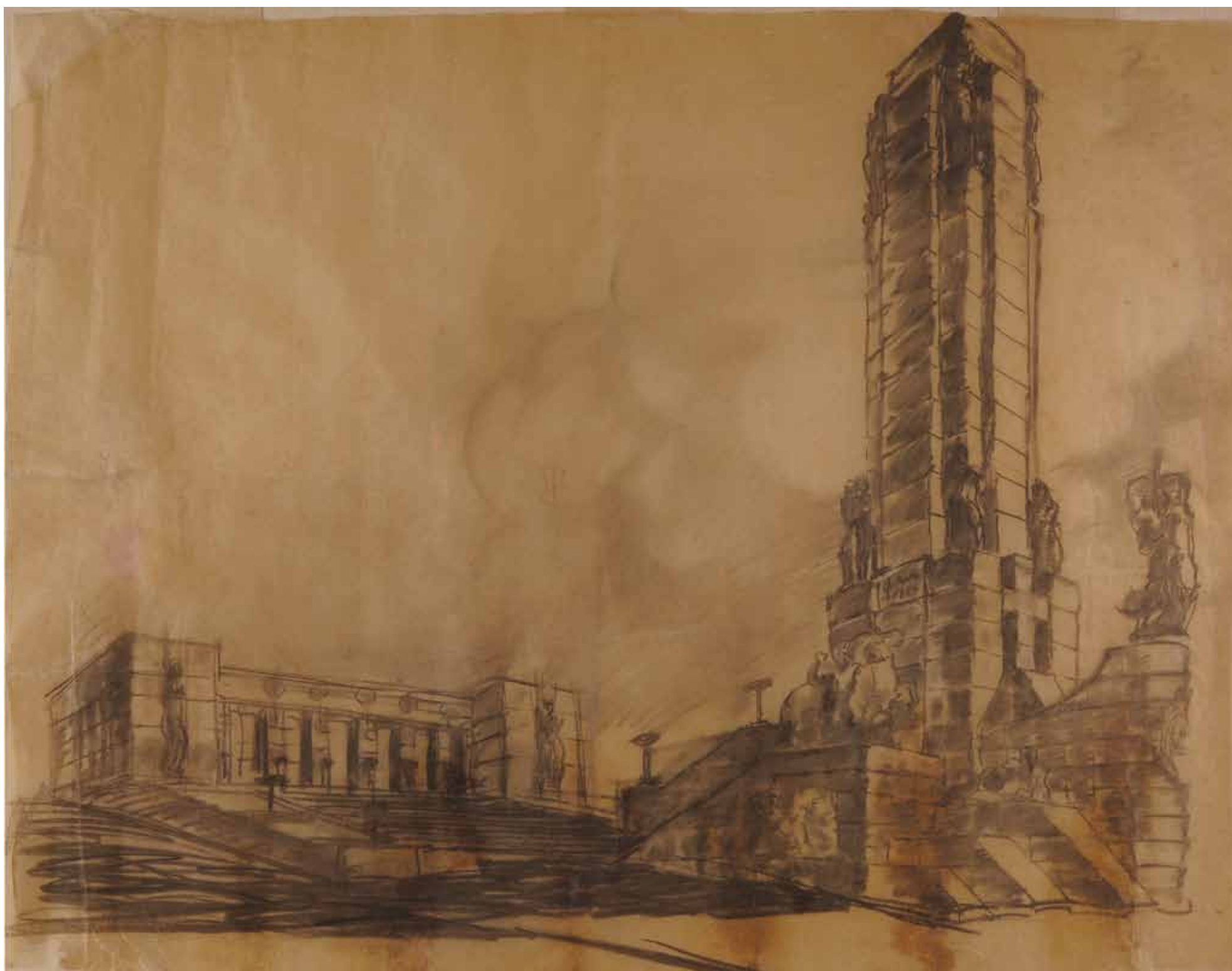
107,50 cm alto x 137,50 cm ancho. Lápiz sobre papel vegetal.