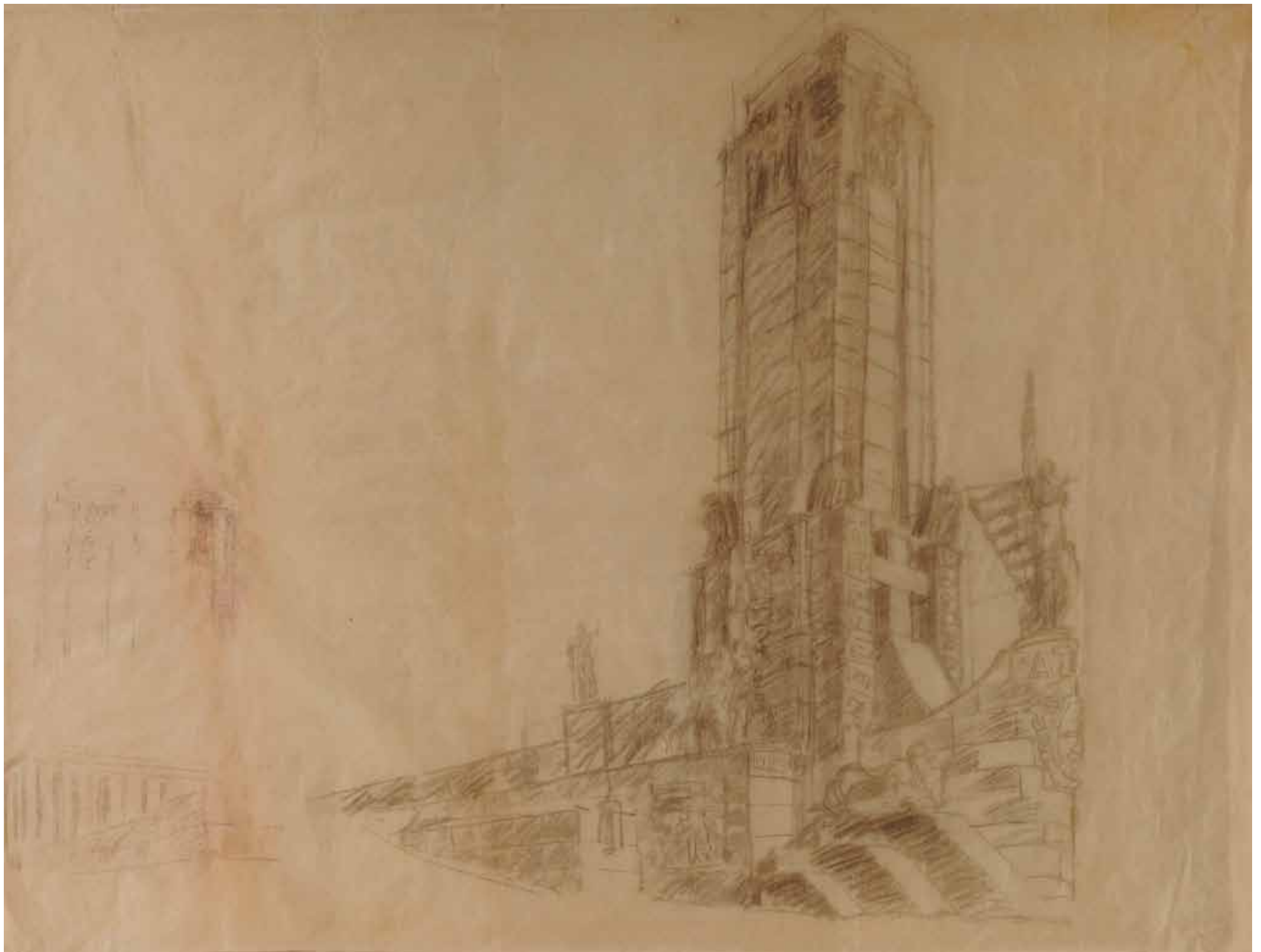
102,50 cm alto x 137,50 cm ancho. Lápiz sobre papel vegetal.