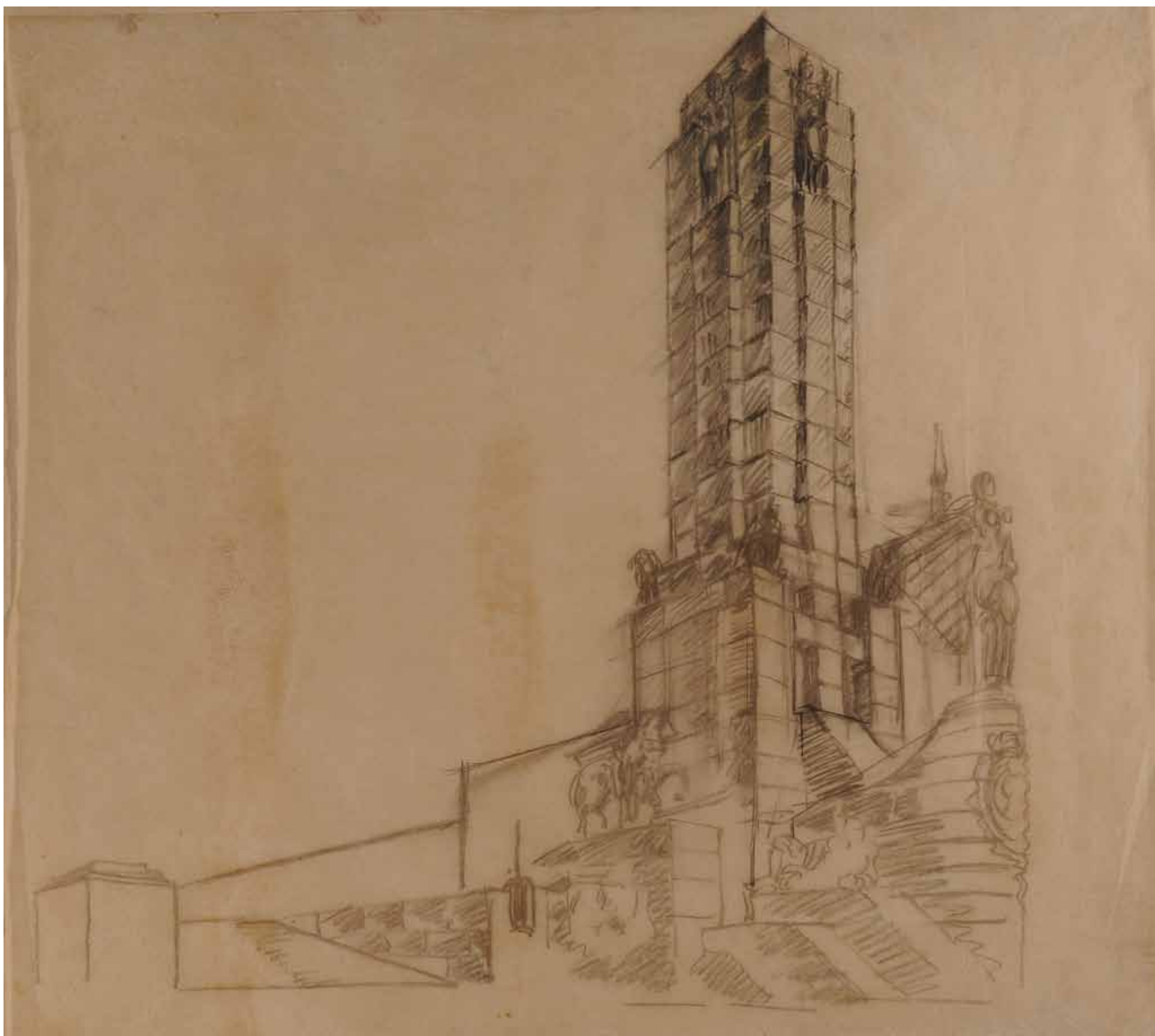
107,50 cm alto x 117 cm ancho. Lápiz sobre papel vegetal.