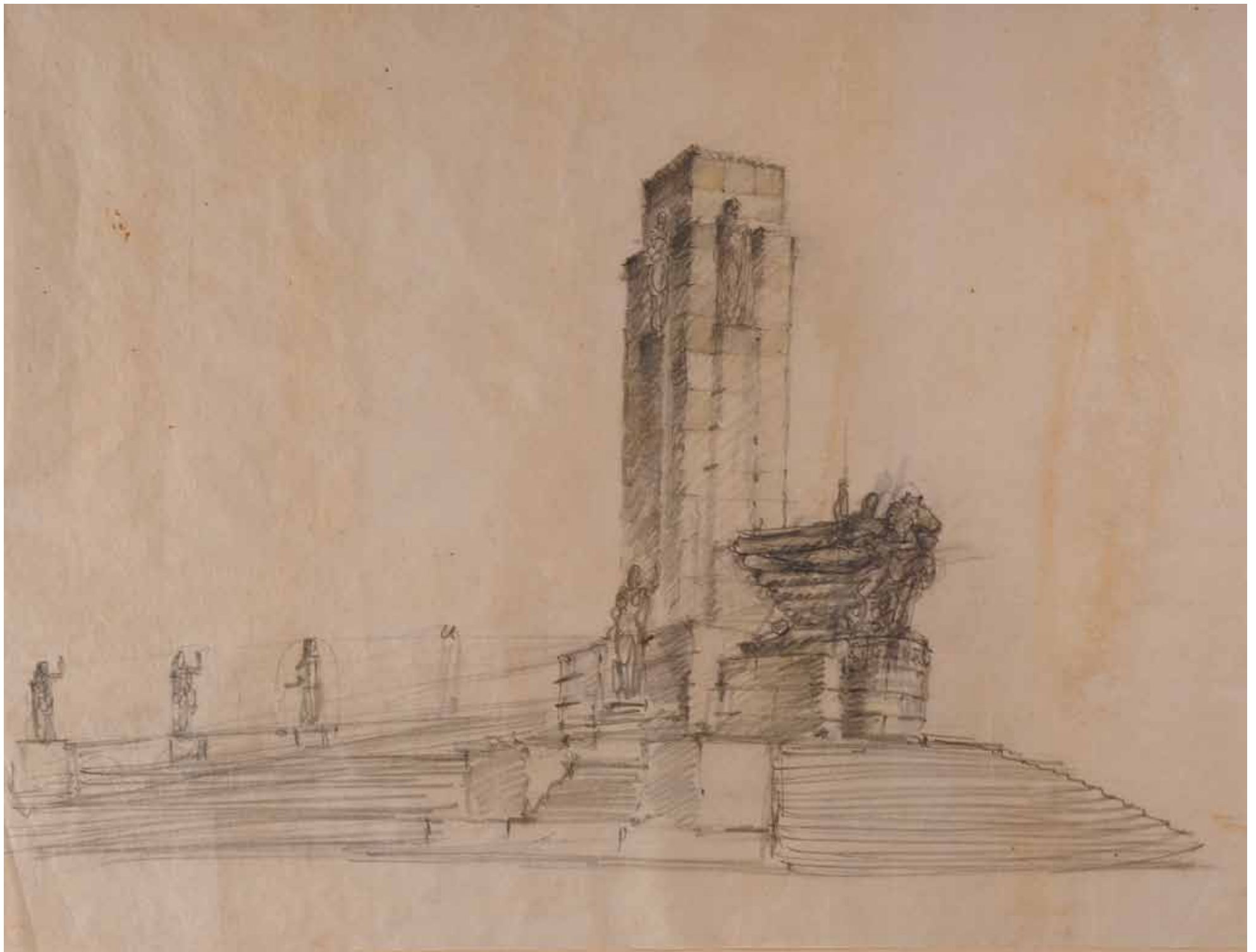
84,50 cm alto x 109,50 cm ancho. Lápiz sobre papel vegetal.