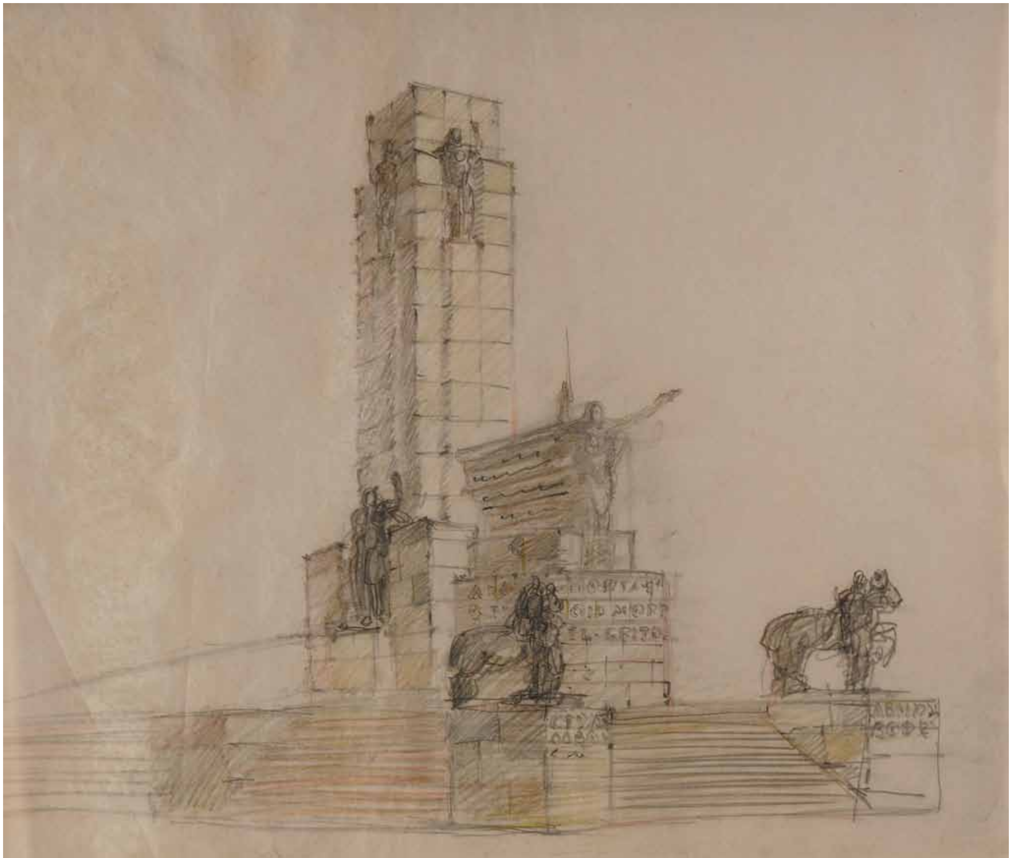
84,50 cm alto x 102 cm ancho. Lápiz sobre papel vegetal.