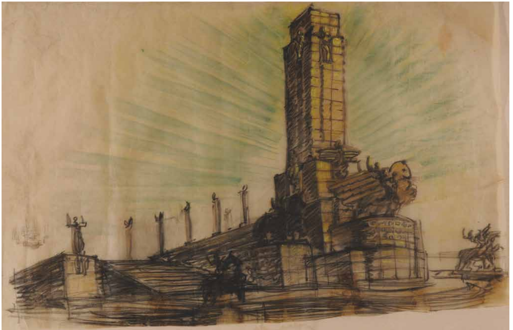
102 cm alto x 157,50 cm ancho. Lápiz sobre papel vegetal.